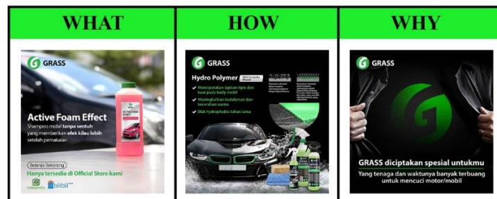
Gambar 1. Contoh the Golden Circle

Berdasarkan observasi yang dilakukan peneliti, per tanggal 8 September 2020 terdapat sejumlah 128 postingan dari akun instagram @grass.indonesia yang memiliki faktor “What”, “How”, dan “Why”, yang akan dijelaskan dengan diagram berikut: