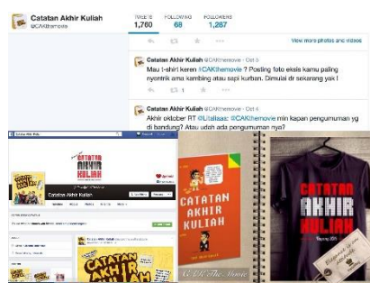
Gambar 6. Screenshot media sosial Dari Hati Films

Promosi selanjutnya yaitu dengan memanfaatkan media sosial. Saat ini rata – rata masyarakat Indonesia khususnya dikota – kota besar sudah terakses dengan adanya internet yang menuntut mereka mengikuti perkembangan jaman. Apalagi masyarakat Indonesia yang senang bersosialisasi yang mendukung media sosial tumbuh pesat sehingga banyak yang menggunakannya. Hal ini yang mendasari rumah produksi Dari Hati Films untuk melakukan promosi melalui media sosial yang bersifat massal dan mendukung para penggunannya untuk berinteraksi lebih dekat.