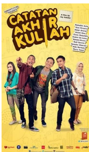
Gambar 3. Poster film Catatan Akhir Kuliah

Film Catatan Akhir Kuliah merupakan film yang di adaptasikan dari novel best seller dengan judul yang sama yaitu Catatan Akhir Kuliah dengan genre drama komedi yang segmentasi pasarnya untuk kalangan remaja dan dewasa. Film Catatan Akhir Kuliah sebuah film yang membahas serta menggambarkan bagaimana kisah seorang mahasiswa di bangku kuliah dalam menghadapi segala macam problematika, menggambarkan perjuangan seorang mahasiswa dalam mendapatkan cita citanya sebagai seorang mahasiswa dalam mengejar gelar sarjana dan juga mengejar cintanya dengan seseorang yang dikaguminya.