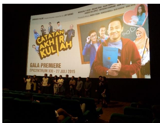
Gambar 8. Gala Premiere film Catatan Akhir Kuliah

Press screening dan Gala premiere merupakan kegiatan nonton bareng film Catatan Akhir Kuliah tayang di bioskop. Bedanya press screening dihadiri oleh para pewarta berita sedangkan gala premiere dihadiri oleh tamu – tamu undangan para insan perfilman Indonesia seperti produser, sutradara, tokoh film dan aktor atau artis ternama Indonesia. Biasanya kegiatan press screening dilaksanakan sebelum acara gala premiere . Ini dimaksudkan agar para pewarta bisa memberikan review tentang film Catatan Akhir Kuliah yang nantinya akan disebar ke masyarakat luas melalui media massanya. Nantinya setelah acara press screening dan gala premiere para pemain dan crew film Catatan Akhir Kuliah akan memberikan press conference kepada pewarta dan melakukan sesi jumpa fans .