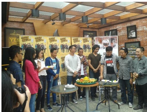
Gambar 7. Press conferencedan syukuran film Catatan Akhir Kuliah

Akhir Kuliah dengan pewarta media massa. Kegiatan ini bertujuan untuk memperluas jangkauan promosi melalui bantuan media televisi, radio, dan portal berita daring. Press conference direncanakan untuk dilaksanakan sebelum proses produksi dimulai, guna menciptakan eksposur awal dan membangun antusiasme publik terhadap film.