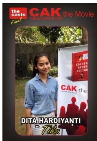
Gambar 5. Salah satu peserta open casting

Dari hasil pengamatan penulis, sekitar 10 orang yang terpilih dari open casting di Jakarta dan hasil roadsow di Bandung, Yogyakarta dan Banjarmasin. Mereka akan mengikuti produksi yang lokasinya di kampus IPB dan Jakarta. Nantinya peran yang mereka mainkan yaitu sebagai pemain pendukung dari pemeran utama film Catatan Akhir Kuliah.